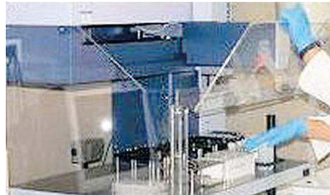
I test per la tipizzazione del midollo osseo

ospitarono gli appuntamenti fecero registrare una media di centinaia di persone: la chiesa di Sant'Anna venne visitata da ospitato 222 persone, quella di Sant'Antonio ne contò 276. Mentre la cattedrale Sant'Andrea accolse accolto 410 visitatori, e ben 546 sono salirono sul suo campanile. In 360 visitarono la chiesa sconsacrata di san Sebastiano e in 424 le vecchie prigioni. In 180 visitarono l'orto botanico e 200 il sito archeologico di S'Ortali e su Monti. Ad Arbatax in 400 ammirarono la torre spagnola san Miguel e in 360 salirono nella collina di Batteria. L'ex tabacchificio registrò 371 firme, 550 Sa Domu beccia, 150 la torre spagnola di San Gemiliano, 502 il Teatro san Francesco, 190 il palazzo dei conti Quigni-Puliga (ex Episcopio), 176 alla Stazione ferroviaria, e 100 le cassette peschiera.