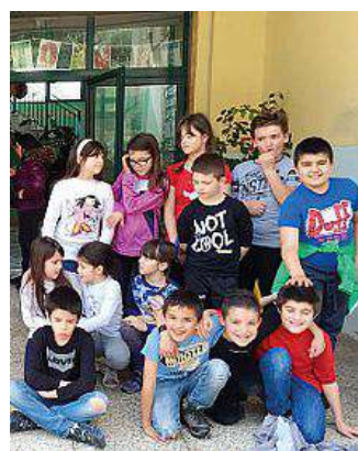
I bambini delle elementari di Urzulei

Urzulei, con una caccia al tesoro si insegneranno ai bambini frazioni ed equazioni