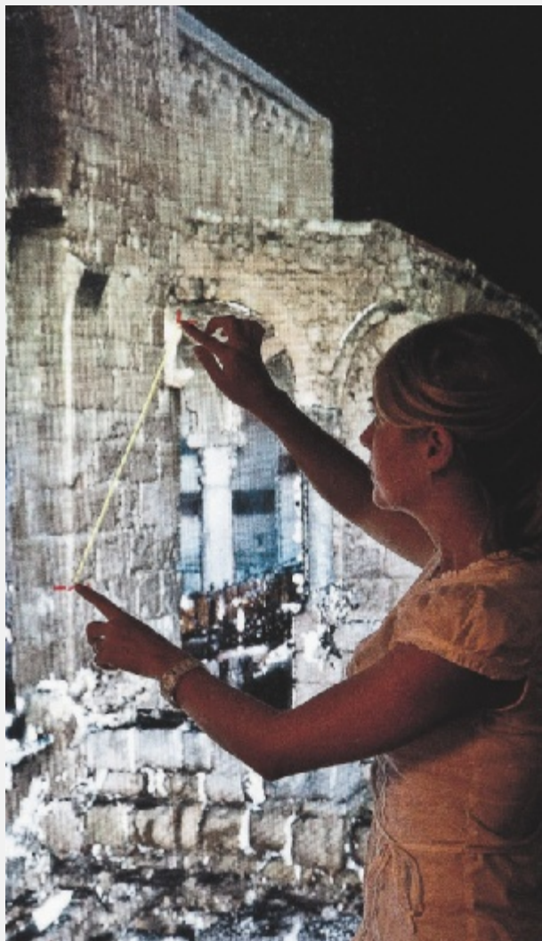
GLI EVENTI Si parte domenica con gli eventi secondari, ospitati negli spazi del T Hotel. A partire da lunedì alle 17 il Centro Congressi della Fiera di Cagliari si animerà in occasione dell'evento principale